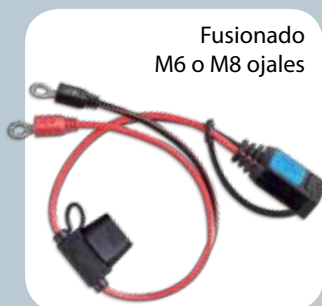
Fusionado M6 o M8 ojales