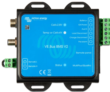
VE.Bus BMS V2