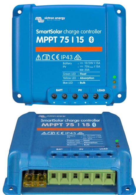
Controlador de carga SmartSolar MPPT 75/15