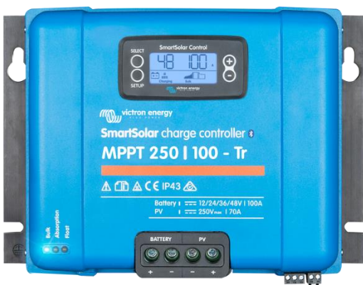
Controlador de carga SmartSolar MPPT 250/100-Tr Con dispositivo conectable