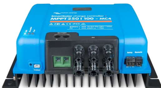
Controlador de carga SmartSolar MPPT 250/100-MC4 Sin pantalla