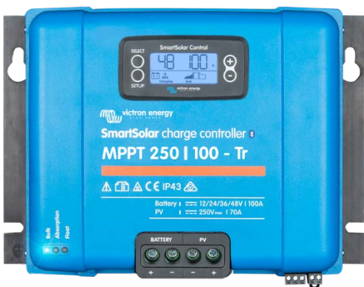
Controlador de carga SmartSolar MPPT 250/100-Tr Con dispositivo conectable