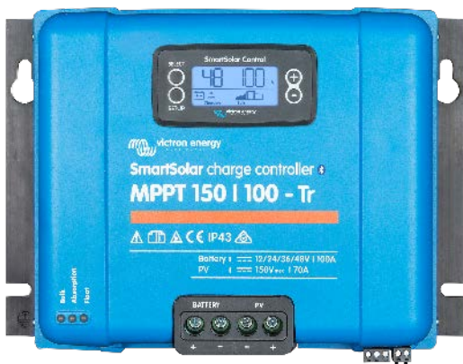
Controlador de carga SmartSolar MPPT 150/100-Tr Con dispositivo conectable