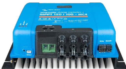
Controlador de carga SmartSolar MPPT 150/100-MC4 Sin pantalla