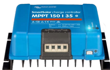
Controlador de carga SmartSolar MPPT 150/35