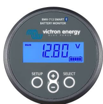
Detección de Bluetooth BMV-712 Smart Battery Monitor