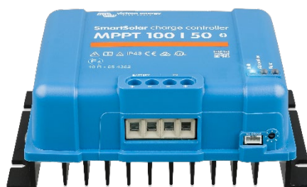
Controlador de carga SmartSolar MPPT 100/50