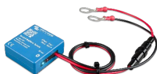
Detección de Bluetooth Smart Battery Sense