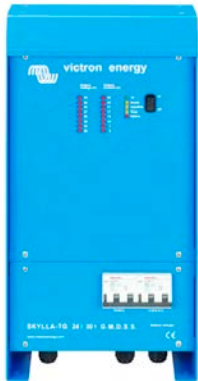
Skylla TG 24 30 GMDSS