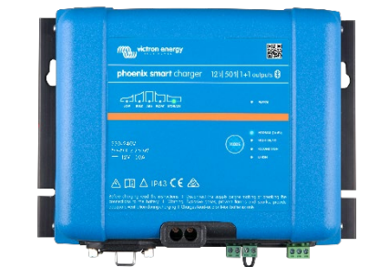
Phoenix Smart 12/50(1+1)

Puede encontrar más información sobre carga adaptativa, en la sección Descargas / Libros blancos de nuestro sitio web.