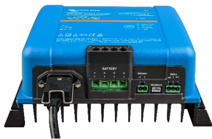
Phoenix Smart 12/50(3)