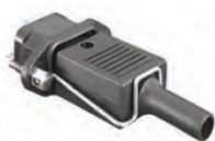
Clip de retención (incluido)