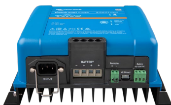
Phoenix Smart 12/50(3)