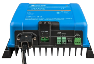
Phoenix Smart 12/50(1+1)