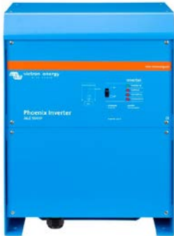
Phoenix Inverter 24/3000