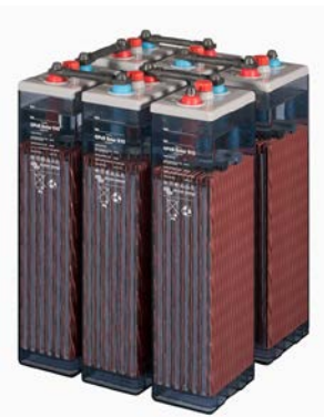
OPzS Solar batteries 910