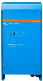
MultiPlus Compact 12/2000/80

Se puede acceder a los datos y cambiar los ajustes de los sistemas con un panel Color Control si está conectado a Ethernet.