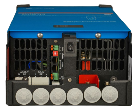
MultiPlus 2000 VA (sin la cubierta inferior)