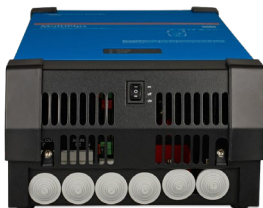
MultiPlus 2000 VA (with bottom cover)