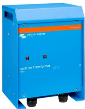
Isolation Transformer 3600W