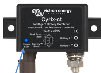
LED indicador de estado