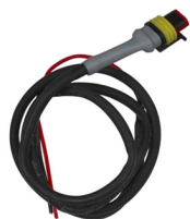
Cable de control para Cyrix-ct 12/24-230 Longitud: 1 m