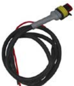
Cable de control para Cyrix-ct 12/24-230 Longitud: 1 m