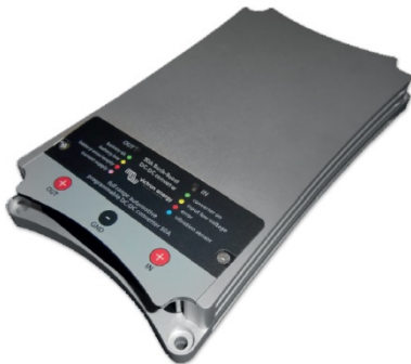
Indicador LED de salida Indicador LED de entrada