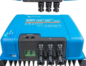
Controlador de carga solar MPPT 150/100-MC4