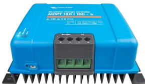
Controlador de carga solar MPPT 150/100-Tr