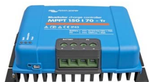
Controlador de carga solar MPPT 150/70-Tr