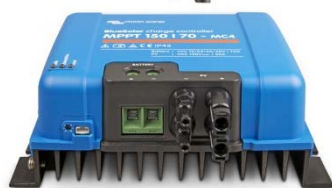
Controlador de carga solar MPPT 150/70-MC4