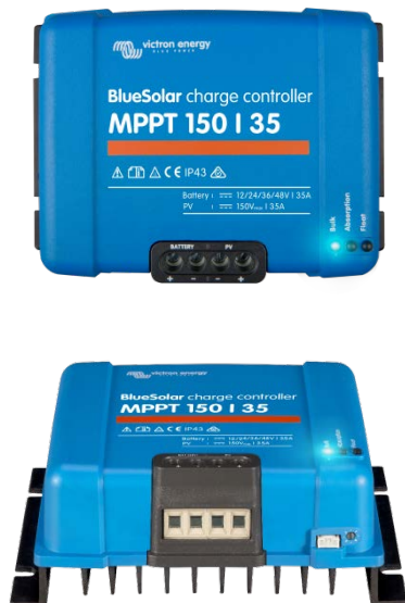
Controlador de carga solar MPPT 150/35