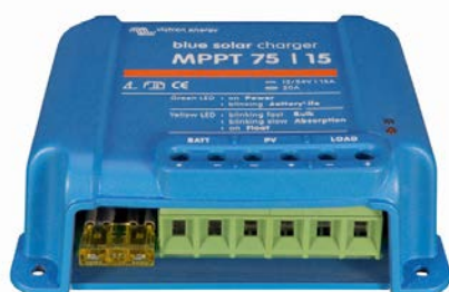
Controlador de carga solar MPPT 75/15