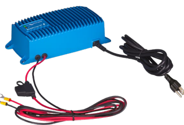
Cargador Blue Smart IP67 12/25