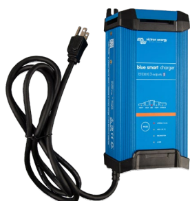
Blue Smart IP22 12/30 (3)