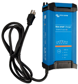
Blue Smart IP22 12/30 (3)