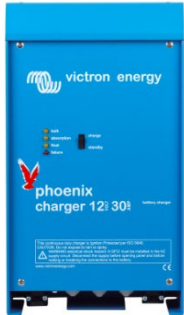
Cargador 12 V 30 A