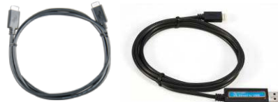
Cables de interfaz - Cables VE.Direct para conectar un BMV 712 al Color Control (ASS030530xxx) - Interfaz VE.Direct a USB (ASS030530000) para conectar varios BMV 70x al Color Control o a un ordenador.