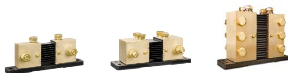
Derivador de 1000A/50mV, 2000A/50mV y 6000A/50mV El circuito impreso de conexión rápida del derivador estándar 500A/50mV también puede montarse en estos derivadores.