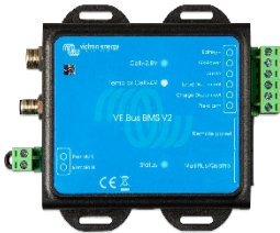
VE.Bus BMS V2