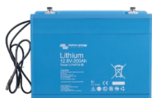
Batería Lithium Battery Smart de 12,8 V y 25,6 V