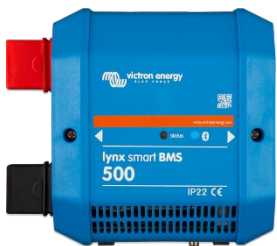
Lynx Smart BMS