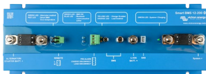
Smart BMS 12/200