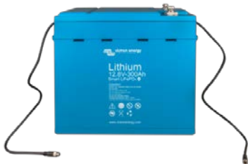
Batería LiFePO4 de 12,8V 300Ah

Muy útil para localizar un (posible) problema, como un desequilibrio de celdas.