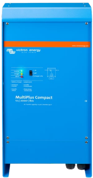
MultiPlus Compact 12/2000/80