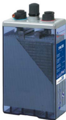
Baterías solares OPzS