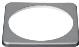
BMV bezel square