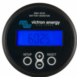
BMV 602S Black

No necesita precontador. Nota: Los conectores RJ45 están galvánicamente aislados del controlador y del derivador.