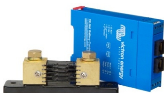
Ejemplo de una curva de carga de batería registrada con un BMV 602 y software VEbat